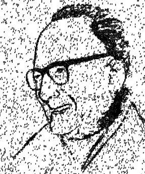
مالك بن نبي